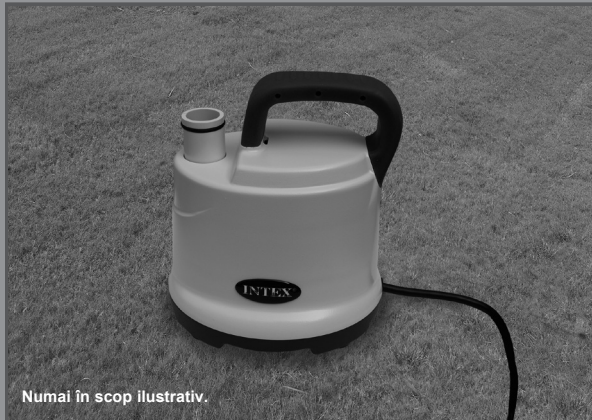
Numai în scop ilustrativ.

Nu uitați să încercați și aceste produse de calitate, marca Intex: piscine, accesorii pentru piscină, piscine gonflabile și jucării folosite în spații închise, saltele pneumatice și bărci, disponibile la distribuitori sau pe site-ul nostru.